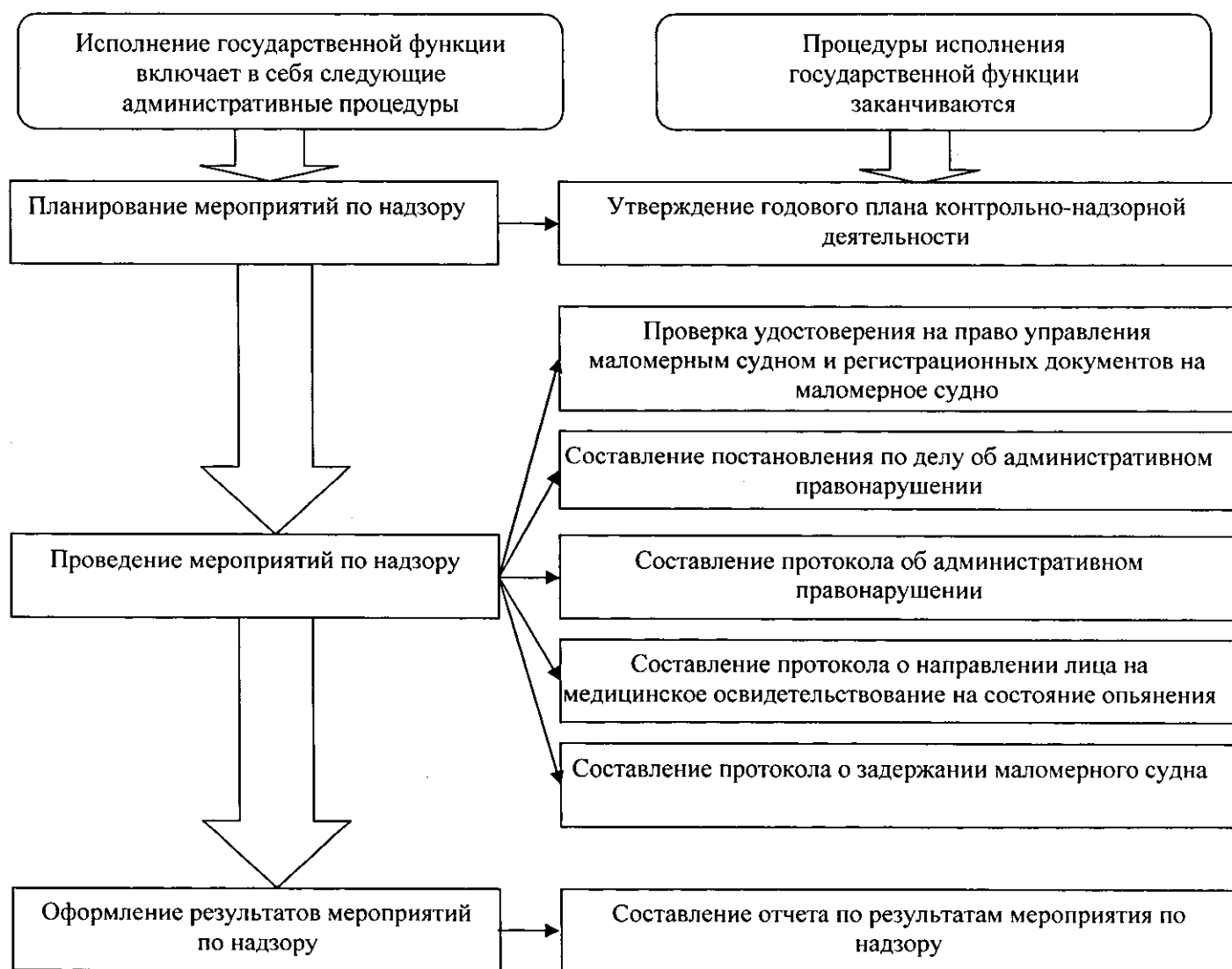
Блок-схема исполнения государственной функции по надзору за пользованием маломерными судами